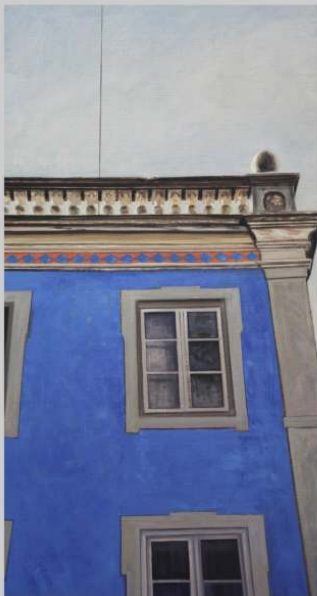
LA CASA AZUL óleo sobre lienzo 97x54 cm